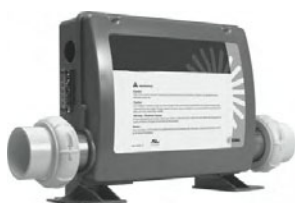
Ce document couvre les systèmes VS et GS 500DZ à 520DZ avec les panneaux Balboa VL801D ou VL802D. www.balboa-instruments.com

Quand le spa est mis sous tension pour la première fois, le mention SET TIME clignote sur l'écran. Appuyer sur « Time » puis « Mode/Prog » suivi de « Warm » ou « Cool ». L'heure se mettra à changer en incréments d'une minute. Appuyer sur « Warm » ou « Cool » pour arrêter l'horaire. Appuyer sur « time » pour confirmer.